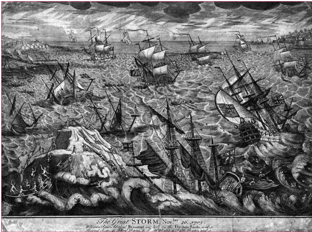
The Grote Storm van 26 november (oude stijl) 1703. De Engelse vloot met schout-bij-nacht Beaumont in problemen op de Goodwin Sands.

Franse Kanaalhavens zoals Duinkerken. In eigen land wordt de schade geminimaliseerd terwijl de tegenstander ze schromelijk overdrijft. De interpretatie van de berichten in de toenmalige kranten zijn moeilijk te interpreteren daar de Spaanse Nederlanden voorafgaandelijk door Frankrijk bezet werden. Een goede indicatie is de manier waarop de geallieerde pretendent voor de Spaanse troon wordt genoemd: Aartshertog Karel (zo genoemd in het Franse kamp) ofwel Koning Karel III. (door de geallieerden). Een andere reden voor het vergeten was dat de storm niet door een stormvloed werd vergezeld en dus niet met groot verlies aan mensenlevens gepaard ging. De algemene windrichting van de windstorm was immers in hoofdzaak zuidwestelijk en stond dus niet haaks op de Vlaamse en Hollandse kusten. Dit was wel het geval voor delen van